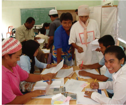
คณะกรรมการกองทุนฯ กำลังฝึกปฏิบัติเพื่อเสริมทักษะทางด้านทำบัญชี โดยการจำลองการจัดการการเงิน ในระหว่างการฝึกอบรมทางด้านทำบัญชี โดยหน่วยงานที่ปรึกษา สิริ คอนซัลท์

ในแต่ละหมู่บ้านจะมีสมาชิกชุดแรกของกองทุน ๑ ละ 50 คน และเปิดรับสมาชิกใหม่เพิ่มตามข้อบังคับของแต่ละกองทุน โดยมีเป้าหมายที่ผู้ที่ได้รับผลกระทบจากภัยพิบัติสึนามิในช่วงเดือนธันวาคมที่ผ่านมาทั้งทางตรงและทางอ้อม ผู้ที่ต้องการกู้ยืมเงินจากกองทุนฯ จะต้องนำเสนอโครงการที่ต้องการจะลงทุน โดยการเขียนนำเสนอรายละเอียด แผนการดำเนินธุรกิจ รวมทั้งงบประมาณ สมาชิกที่ได้กู้เงินไปแล้ว จะต้องส่งเงินคืนกองทุนตามระยะเวลาที่ได้รับไว้ในแผนการดำเนินธุรกิจที่ได้ยื่นขอขอกู้ขึ้น ทั้งนี้เพื่อให้