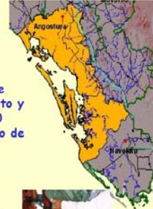
PRODUCCION DE CAMARON Y NUMERO DE PESCADORES EN LA BAHIA SANTA MARIA DE LA REFORMA

La producción de camarón en 1979 fue buena. De 1989 a 1992 fue en aumento y se ha sostenido alrededor de las 1500 toneladas anuales, teniendo el máximo de la década en 1997.