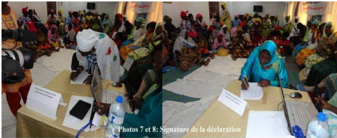
Figure 8: Signature de la déclaration

Un draft de plan d'action triennal opérationnel (en annexe), a été élaboré et validé par les participants. Lors de l'atelier sur le renforcement des capacités des CPLA ce travail a été restitué de manière plus large. Les participants ont procédé à une priorisation des activités définies dans ce plan d'action et ont fait des recommandations attachées en annexe 4. L'ensemble de ces documents permettra au WWF et ses partenaires de rédiger la stratégie de renforcement des capacités des femmes actives dans la pêche à travers les Unité de Gestion Durable (UGD) .