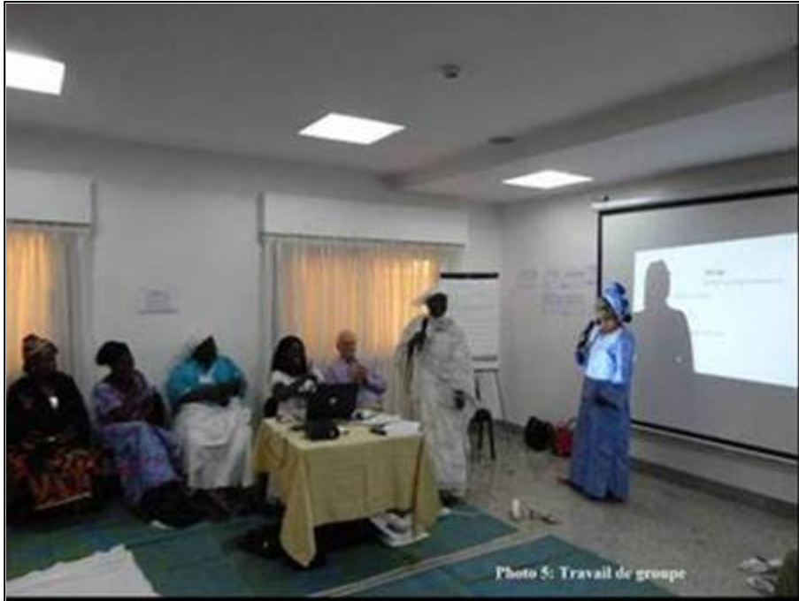
Figure 6 : Travail de groupe

Les échanges qui ont suivi ont montré la place et le nombre de plus en plus important des femmes actives dans la pêche. Elles contribuent aux dépenses et au bien-être des familles. Cependant, on a remarqué que non seulement les femmes perdent de plus en plus le monopole de certains métiers clés mais aussi et surtout que la plupart des métiers exercés par les femmes ne sont pas valorisés. Ceci explique le fait que la quasi-totalité de l'intervention des femmes est réduite actuellement à la transformation artisanale, au micro-mareyage et au mareyage des produits de la pêche. D'où la nécessité d'une meilleure connaissance et prise en compte de l'ensemble des métiers exercés par les femmes dans le secteur pour pouvoir quantifier leur poids réel dans la pêche.