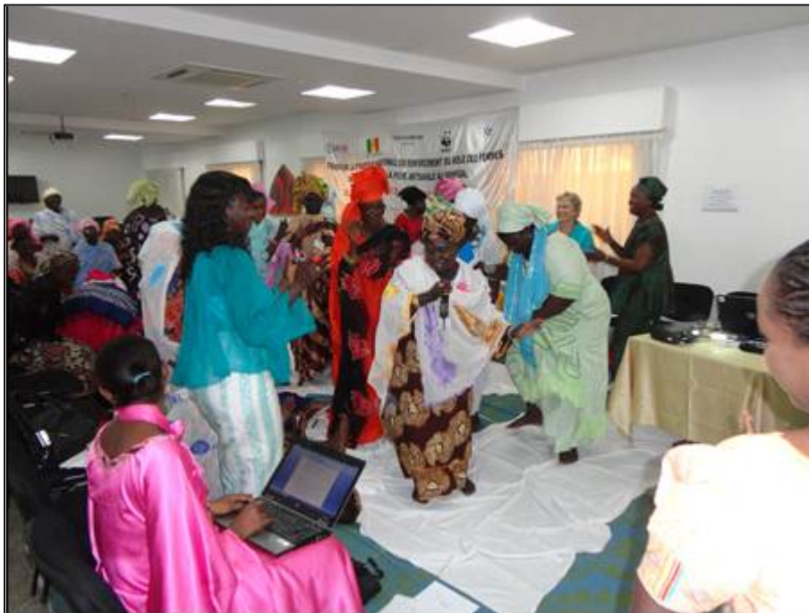
Figure 1 : Utilisation du dialogue interactif, des danses et des chants traditionnels.