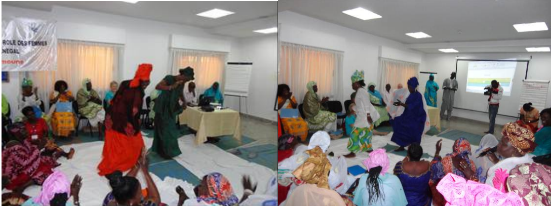
Figure 2a and 2b : Elaboration du plan d'action et de la déclaration des femmes dans le secteur de la pêche.

deux jours de réflexion avec uniquement les femmes pour l'élaboration du plan d'action et de la déclaration des femmes. Un troisième jour a été consacré à la validation de ces documents par les hommes (chefs de service des pêches, DPM, acteurs à la base) afin que ceux-ci acceptent et s'approprient le et travail des femmes.