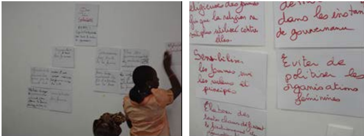
Figure 7a and 7b : Les femmes ont développé une vision qui est une projection dans l'avenir du rôle et des responsabilités que les femmes sont appelées à jouer et à occuper dans le secteur des pêches.

Ce travail de réflexion qui a fait l'objet de validation en plénière résume les attentes et préoccupations des femmes dans le secteur de la pêche.