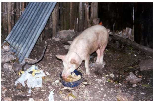
Fig.-10 Cría de cerdos en los solaes