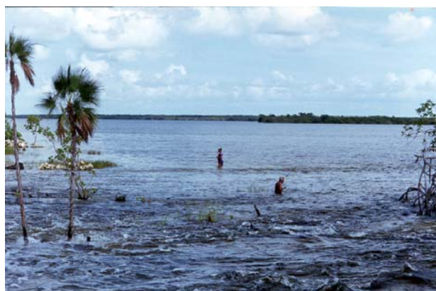
Fig.-13 Actividades pesqueras para el autoconsumo.

En el contexto de las historias orales de los pobladores de Raudales, la laguna y los recursos del ejido han sido espacios que adquirieron valoraciones diversas a lo largo del tiempo. Estas visiones históricas de los recursos han estado asociadas a las ideas de conservación y protección de los mismos como responsabilidad de la comunidad, pero especialmente de los ejidatarios. Desde hace aproximadamente quince años se han emprendido acciones con estos fines en la comunidad de Raudales.