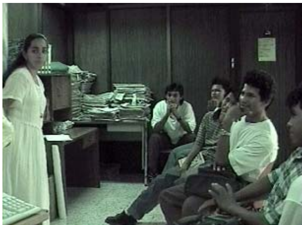
Fig.- 18 Taller impartido a los Guías Naturistas.

Estos guías pueden ser caracterizados como un grupo con tendencia al cambio, y que perciben como una necesidad de dicha movilidad social la capacitación formal (inglés, flora, fauna, servicios, gestiones, entre otros) para hacer frente a esta nueva actividad calificada como prometedora por ellos mismos. Visualizan a futuro su integración de tiempo completo a un tipo de desarrollo ecoturístico en su comunidad.