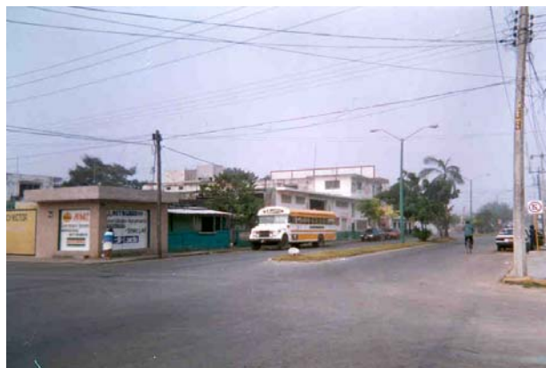
Fig.-5 Paradero de salida a Laguna Guerrero y Raudales en Chetumal.

Existe una carretera que comunica a la población de ambas comunidades con la ciudad de Chetumal a 34 kilómetros de distancia aproximadamente. De Laguna Guerrero a La Península existe otro camino de 20 kilómetros. De Laguna Guerrero a la comunidad de Raudales hay una distancia de 5 kilómetros.