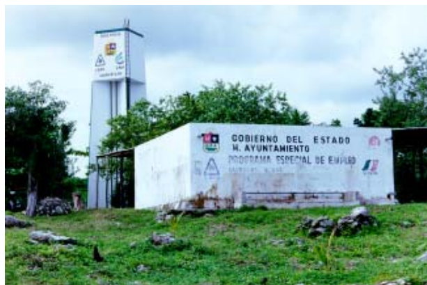
Fig.-4 Servicios públicos con que cuentan las comunidades

La comunidad cuenta con servicios públicos como luz eléctrica, abastecimiento de agua entubada en las casas, aunque el servicio es irregular debido a problemas con la planta de bombeo; además de la calidad salobre del agua y la contaminación del aljibe; por lo que las mujeres y los menores son los encargados de acarrear el agua que se toma, abasteciéndose del aljibe de Raudales.