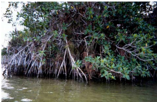
Fig.-12 El mangle como importante recurso natural de la zona.

Para conocer las condiciones de la participación social de los pobladores locales en la construcción de un proyecto común, como puede ser el MIRC, es importante definir las condiciones de propiedad y uso de los recursos en ambas comunidades.