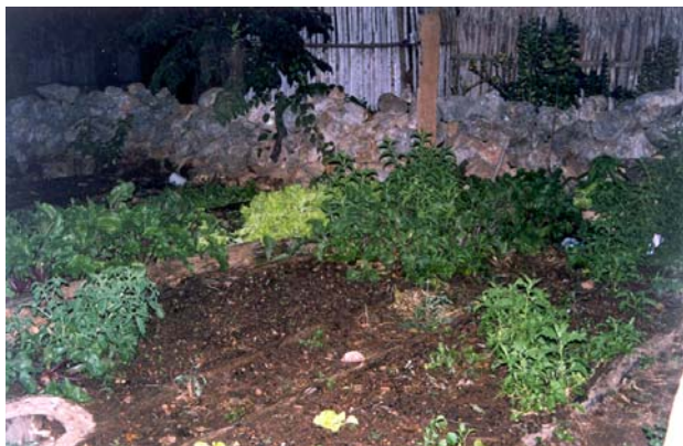
Fig.-3 Solar utilizado como huerto familiar

contrarios, es decir, existen terrenos con dimensiones mayores de 50 m. por 50 m. y nuevos propietarios que adquirieron terrenos con medidas diferentes al estandar inicial. Por esta razón, la traza del espacio urbano es irregular y tendría que verificarse a través de otros medios de primera mano, pues no hay tal registro en las instituciones oficiales 13 .