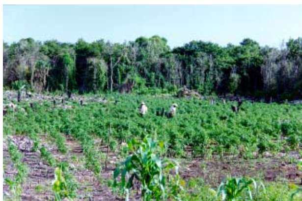
Fig.-11 Trabajo asalariado realizado por la misma gente de la comunidad.