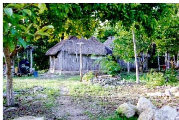
Fig.-2 Vista de un solar de la zona urbana.

La historia de poblamiento en Laguna Guerrero está relacionada con la dotación de tierras ejidales en la época cardenista y con los procesos de migración dirigida de la década de los setenta en Quintana Roo. Este poblado es más antiguo que Raudales, obtuvo su reconocimiento como ejido en agosto de 1943, la dotación de tierras originalmente fue de 13,121 Ha., superficie entregada a finales de 1944 para beneficiar a 30 ejidatarios; para 1962 sólo había en el poblado 58 habitantes y 19 vecinos con derechos ejidales; sin embargo, diez años después, la población creció considerablemente debido a la migración de nuevos colonos del interior del país, y se consideró la necesidad de una nueva dotación ejidal para 160 ejidatarios en 1986, y posteriormente para 231 en 1988 12 .