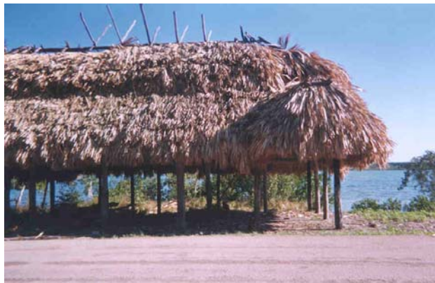
Fig.-6 Palapa en construcción de los Guías Naturistas

A lo largo del perímetro de la laguna que le corresponde al ejido, se encuentran asentadas cinco palapas; dos de las cuales brindan servicios de venta de cervezas y pescado frito todos los días de la semana a los visitantes provenientes de Chetumal y de otros lugares; las otras tres palapas se encuentran en construcción.