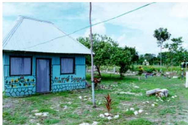
Fig.-8 Jardín de niños en Raudales.

En Raudales, la zona considerada urbana abarca a 360 solares. Esta zona comprende aquellos asentamientos que prestan servicios públicos religiosos, educativos, médicos y recreativos como la Iglesia del Séptimo Día, la Iglesia Católica de la Virgen del Carmen, el Templo Alfa y Omega, la Escuela Primaria Josefa Ortíz de Domínguez, el Jardín de Niños Quisifor, la Unidad Médica de Primer Nivel de Atención y el Balneario Ejidal 15 .