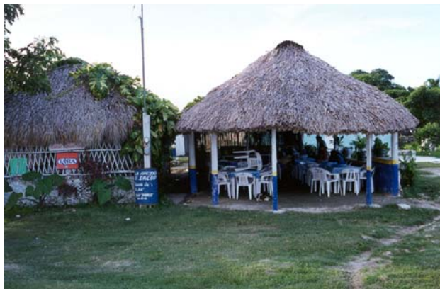
Fig.-17 Restaurantes establecidos

c) Expectativas y proyectos futuros de los grupos sociales de las comunidades.