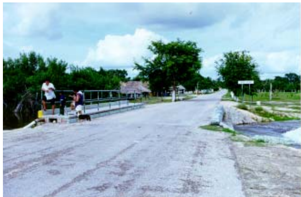
Fig.-7 Puente de acceso a la comunidad de Raudales

El servicio médico para la población de Laguna Guerrero lo otorga dos días a la semana la médico residente que vive en Raudales. El servicio es irregular porque es utilizada la delegación municipal como consultorio, ya que la Unidad Médica de Laguna Guerrero se encuentra en construcción. También en la comunidad viven parteras, que tienen una práctica cotidiana en ambas comunidades.