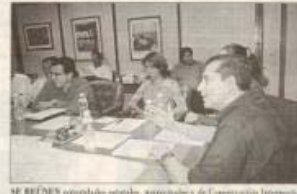
SE REUNEN autoridades estatales, municipales y de Conservación Internacional México para diseñar instalaciones de paramunicipal.

Dijo que actualmente se están ejecutando proyectos sustentables que se ven los límites de pesca, los cultivos, beneficiarios, distribución, el apoyo financiero de los gobiernos de los 5 campos: comunitarios de Bahía y Angostura y Navolato se